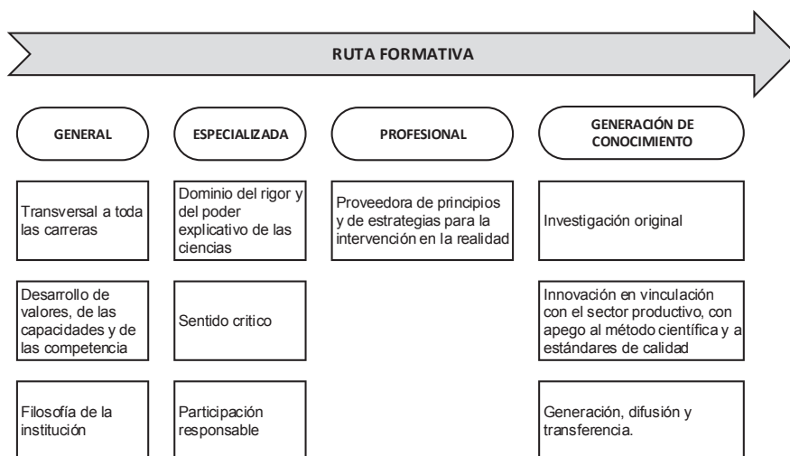
Figura 2: Estructura Curricular del Nivel de Grado

La ruta formativa sigue la siguiente secuencia: